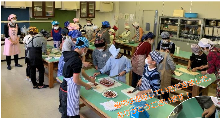
鴨肉は寄付していただきました。 ありがとうございます！

年度末、いろいろありましたが皆様いかがお過ごしでしょうか？ 今年度もたくさんのご協力をありがとうございました。子どもたちの活動が豊かになり、たくさんの笑顔が生まれました。これからもよろしくお祈いします！