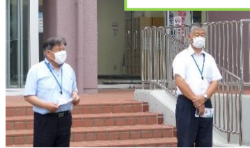
7/9 バスで町たんけん