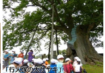
「行人塚の大ケヤキ」

ずっと昔、疫病が流行った時に、それを鎮めるために旅のお坊さんがケヤキの祠に入ったと云われています。