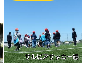
サルビアサッカー場