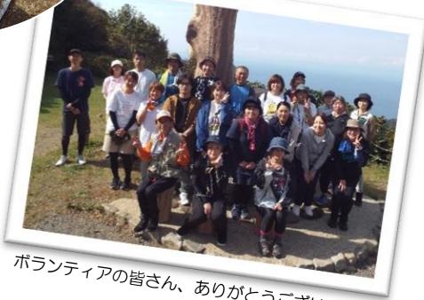
ボランティアの皆さん、ありがとうございました！